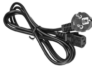
Przewód do zasilania 230 V IEC C13