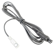
Sonda do pomiaru temperatury ST-3