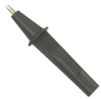
Sonda dwustronna Kelvina (gniazda bananowe)