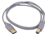
Przewód do transmisji danych USB