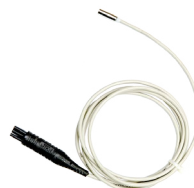
Sonda do pomiaru temperatury ST-1