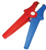
2 x Krokodylek Kelvina 1 kV 25 A