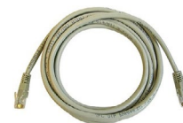
Przewód sieciowy LAN zakończony wtykami RJ45