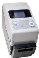
Drukarka raportów / kodów (USB, przenośna)