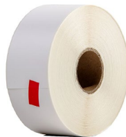
Taśma / papier do drukarki SATO (z klejem)