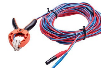
Przewód 25 m dwużyłowy zakończony krokodylem Kelvina