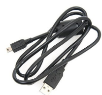
Przewód do transmisji danych mini USB