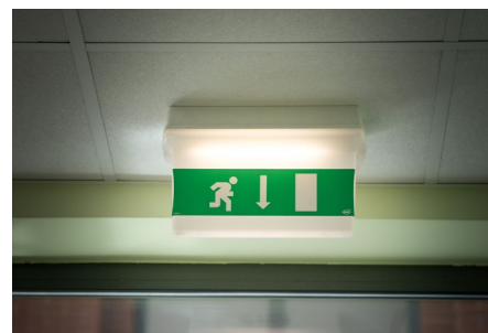
Pomiar oświetlenia awaryjnego i ewakuacyjnego

Model o rozdzielczości 0,01 lx pozwala na dokładne pomiary oświetlenia w miejscach pracy oraz oświetlenia awaryjnego, m.in. dróg ewakuacyjnych. Współpracuje z głowicą pomiarową LP-10B. Urządzenie posiada wbudowaną pamięć na 999 pomiarów oraz dodatkowy logger do rejestracji danych w określonej przez użytkownika częstotliwości próbkowania.