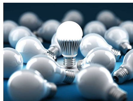
Pomiar oświetlenia LED

Urządzenie najwyższej klasy użytkowej A. Pozwala na wykonanie najdokładniejszych pomiarów w strefach przemysłowych i obiektach użyteczności publicznej. Dodatkowo przyrząd ma możliwość bezprzewodowego wysyłania danych do programu komputerowego Sonel Reader oraz Sonel Foton 3.