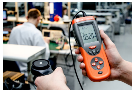
Pomiar na stanowiskach pracy

Model skierowany dla osób wykonujących podstawowe pomiary natężenia oświetlenia miejsc pracy wewnątrz i na zewnątrz. Urządzenie współpracuje z głowicą pomiarową LP-1 (klasa B), pozwalającą na wykonywanie wiarygodnych pomiarów. Niezintegrowana głowica eliminuje wpływ użytkownika na wynik pomiaru.