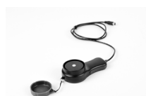
Soda luksomierza LP-10A (do LXP-10A)