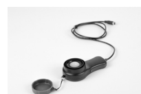
Soda luksomierza LP-1 (do LXP-2)