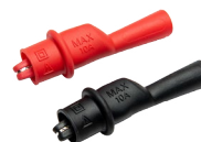
Krokodyłek mini, 1 kV 10 A (kpl.)