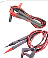
Komplet przewodów pomiarowych